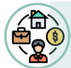
Tavola rotonda con orientatori e imprese sul tema STEM - fine gennaio

Uno degli stereotipi esistenti dentro il sistema formativo è quello di una presunta scarsa attitudine delle studentesse verso le discipline STEM (Scienza, Tecnologia, Ingegneria, Matematica) che conduce a un divario di genere in questi ambiti sia nelle scelte del percorso di studi che nelle scelte professionali.